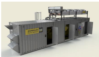
Netzersatzanlage als Containerlösung